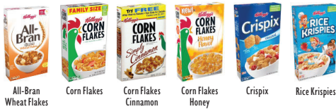
All-Bran Wheat Flakes Corn Flakes Corn Flakes Cinnamon Corn Flakes Honey Crispix Rice Krispies