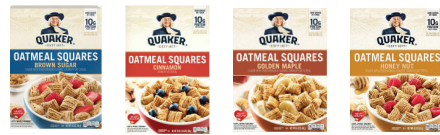
Oatmeal Squares Brown Sugar