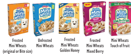
Frosted Mini Wheats (original or Bite size) Unfrosted Mini Wheats Frosted Mini Wheats Golden Honey Frosted Mini Wheats Mixed Berry Mini Wheats Touch of Fruit