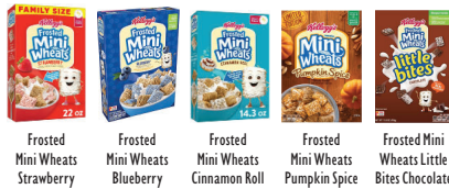
Frosted Mini Wheats Strawberry Frosted Mini Wheats Blueberry Frosted Mini Wheats Cinnamon Roll Frosted Mini Wheats Pumpkin Spice Frosted Mini Wheats Little Bites Chocolate