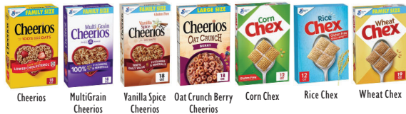
Cheerios MultiGrain Cheerios Vanilla Spice Cheerios Oat Crunch Berry Cheerios Corn Chex Rice Chex Wheat Chex