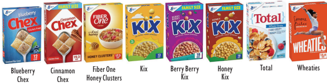
Blueberry Chex Cinnamon Chex Fiber One Honey Clusters Kix Berry Berry Kix Honey Kix Total Wheaties