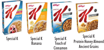
Special K Special K Banana Special K Touch of Cinnamon Special K Protein Honey Almond Ancient Grains