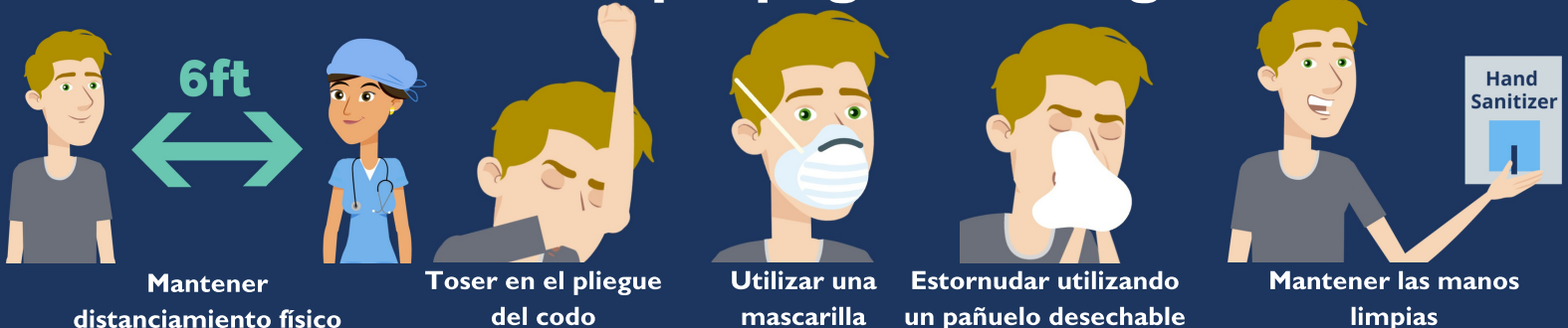
Mantener distanciamiento físico