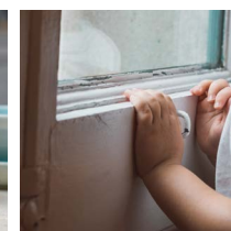
رنگ سربی روی کلکین های قدیمی