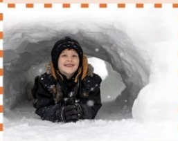
Build a Fort