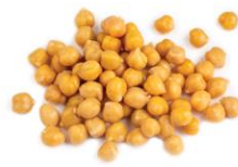
Garbanzo Beans /Chick Peas